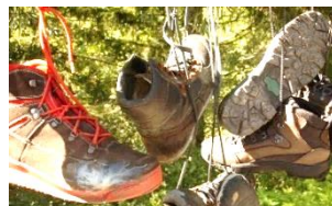
Text und Foto: Rudi Berzl

Wer geht meine Wege mit? Auf wen vertraue ich?