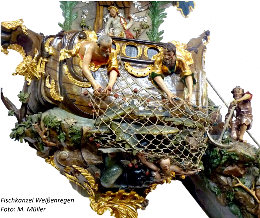
Fischkanzel Weißenregen

Sie begeistern für ein Leben, das nicht nur dem Überleben dient, sondern dem Leben einen Sinn verleiht: Für andere da sein. Für andere leben.